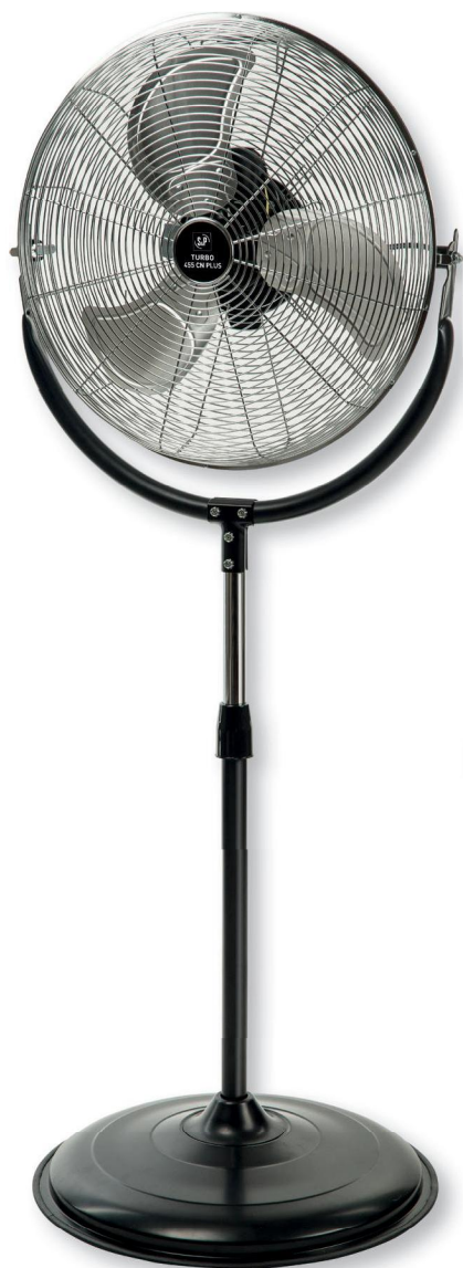
TURBO-455 CN PLUS