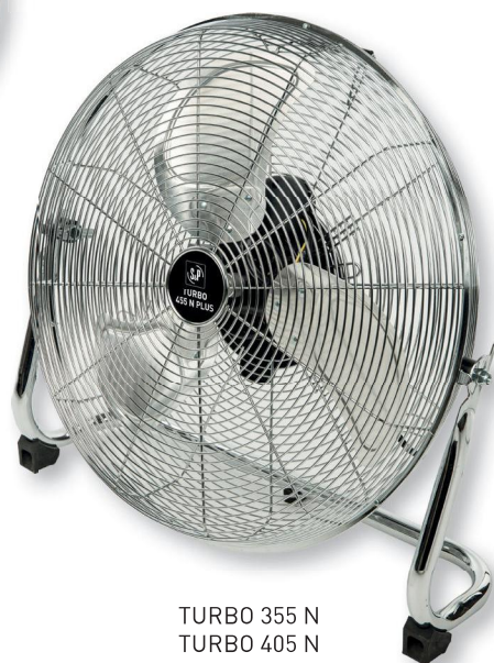
TURBO 355 N TURBO 405 N TURBO 455 N PLUS

Вентиляторы серии TURBO-N обладают высокой производительностью и предназначены для использования в общественных и промышленных помещениях. Доступны три модели для напольной установки с диаметром крыльчатки 360, 400 и 450 мм и одна модель на телескопической ножке с диаметром 450 мм. Вентиляторы комплектуются 3-х скоростными электродвигателями с защитой от перегрева и ручкой для переноски.